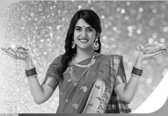
सोने तारण कर्ज