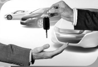
वाहन तारण कर्ज