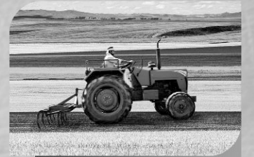
कृषी विकास कर्ज